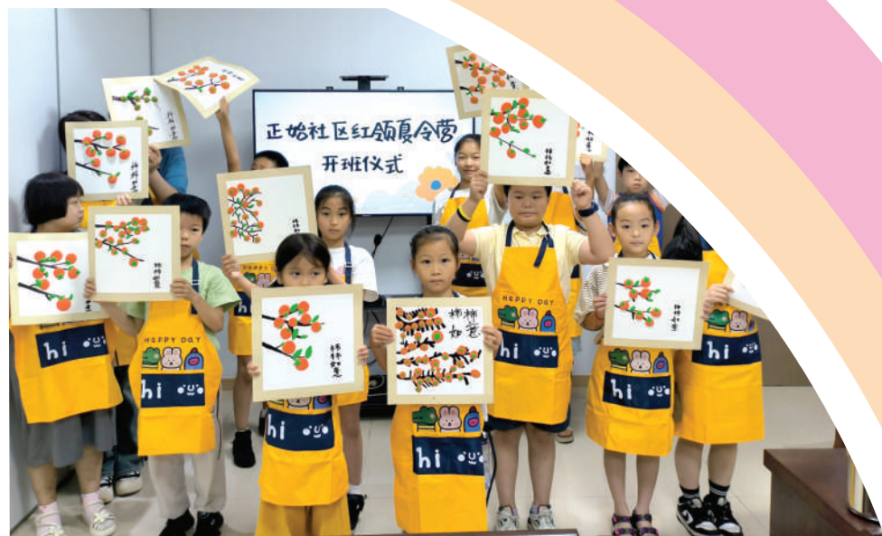
正始社区志愿者开办公益暑期班。