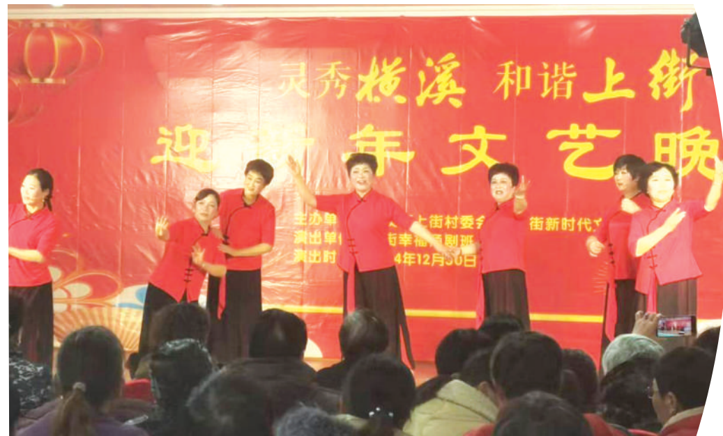
上街村文艺志愿者精心筹备2025年新春文艺晚会节目。