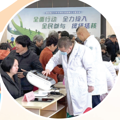
开展入村义诊和健康宣教活动。