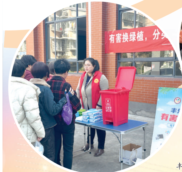
丰乐社区开展“绿植兑换日”志愿服务活动。