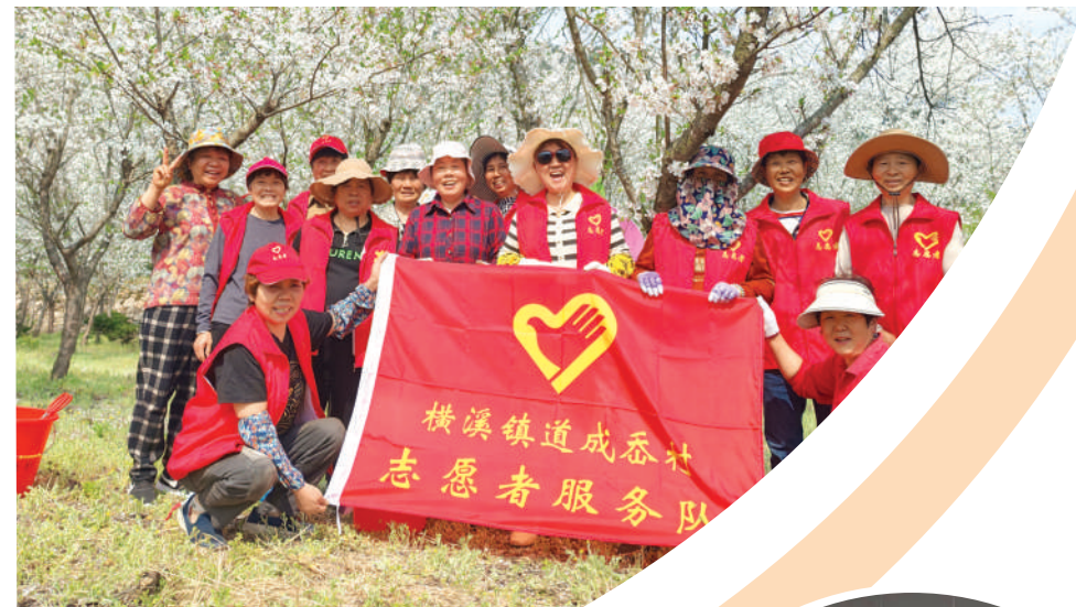
道成畚村志愿服务队开展环境卫生志愿服务行动。